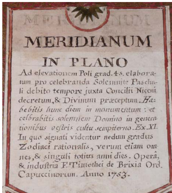
fig. 3 Iscrizione sulla parte verticale sotto al foro gnomonico.