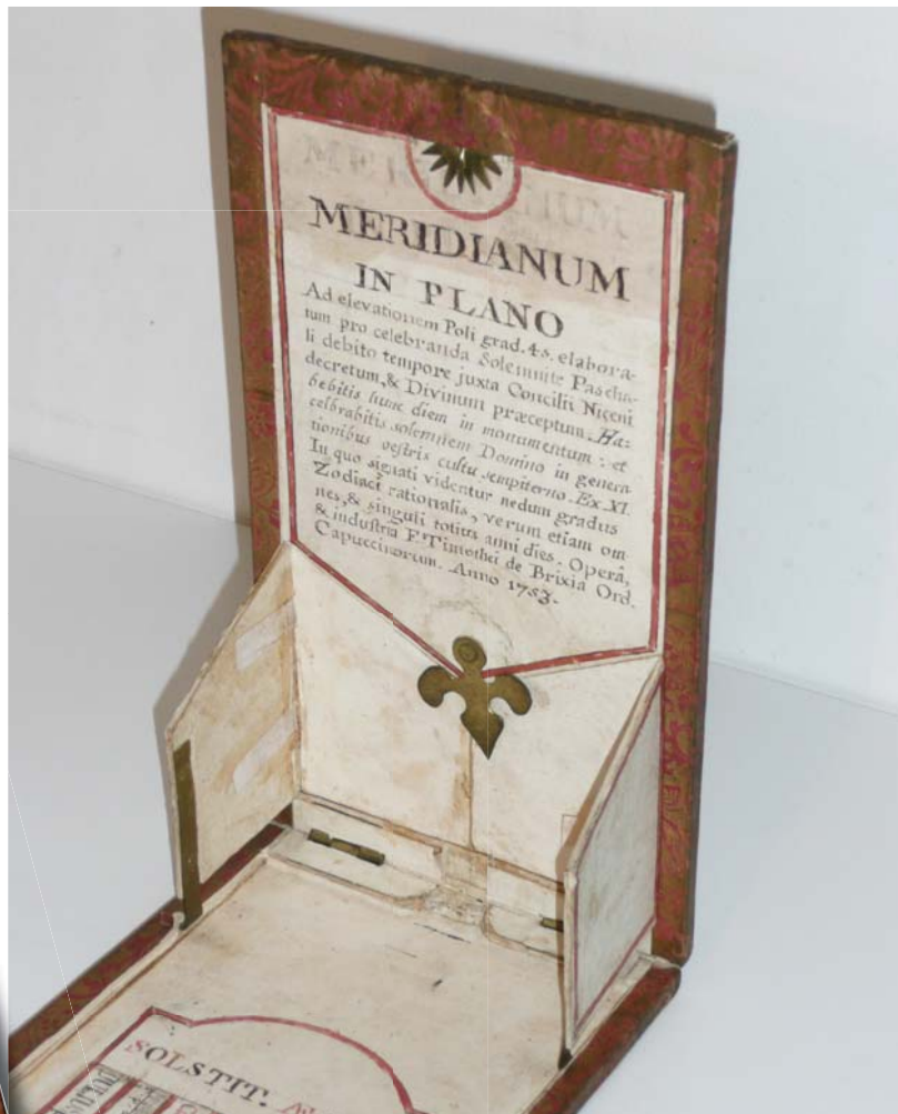
fig. 4 La meridiana aperta in posizione di lavoro.