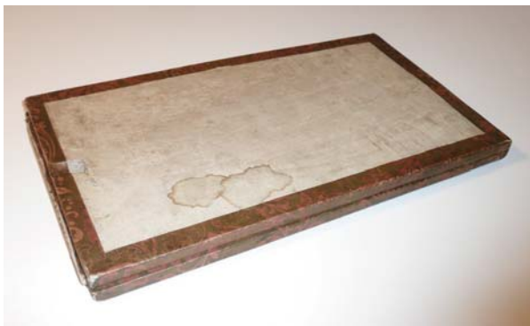
fig. 1 La meridiana chiusa in posizione di riposo.